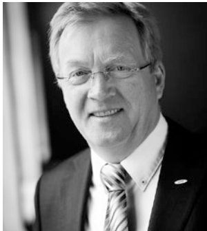
Andreas Westerfellhaus Präsident des Deutschen Pflegerats