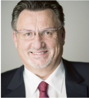
Franz Wagner Präsident des Deutschen Pflegerats